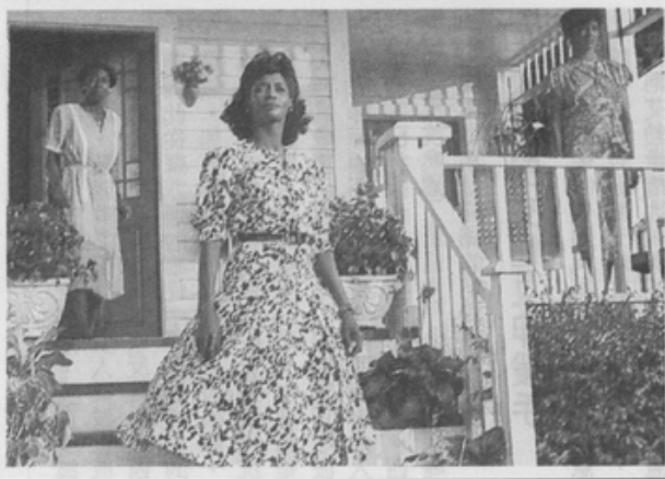
片中女性在覺醒後，看到了光明的未來