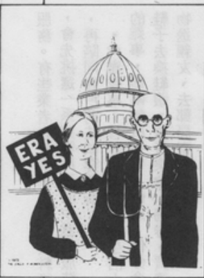
爭取 equal pay 等權利修正法案是美國多數女性主義者的目標

（本文摘錄自李元貞女士七月五日在本社「兩性成長聚會」中的演說。演說中曾談到台灣婦女運動的成就與局限，因本刊篇幅有限，暫予省略）