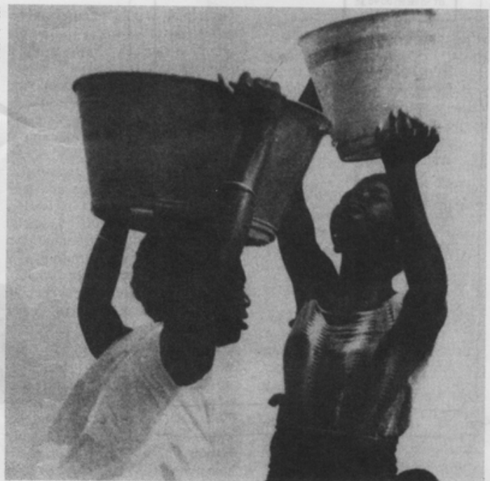
供水是女人和小孩的工作

地區，她們還是農事用水的主要使用者。研究指出，世界各地的農業地區中，男人幾乎都包辦了開始階段的整地犁田工作，但接下去的種植、除草、收割、儲存、加工、販賣等工作，女人大量參與，甚至全盤包辦，所以女性用水的機會甚至多於男性。