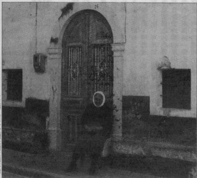
一位婦人在一家觀光農社前休息。

書中將精神病的演進劃分爲三期：維多利亞時代精神病學時期（一八三〇至一八七〇年）、達爾文時代精神病學時期（一八七〇至一九二〇年）、及現代精神病學時期（一九二〇至一九八〇年）。作者指出，從十七世紀起，英國女性精神病患多於男性的現象就和文化有關。以維多利亞時期爲例，女多於男，一方面由於女人壽命較長；另一原因則是：男人對女人的態度影響了社會對女人精神不正常的定義。因爲「社會認爲女人是孩子氣、不理性、性慾捉摸不定的。同時，女人在法律上沒有力量，在經濟上處於邊緣地帶。」她們自然較易得精神病，或被當時的醫生判定爲精神有問題。 到了十九世紀後期，精神醫學界注意到衆多女性歇斯底里患者。從文化的角度來看，本書作者指出，這種現象與十九世紀中產階級婦女受限太多及人生無目標有關。