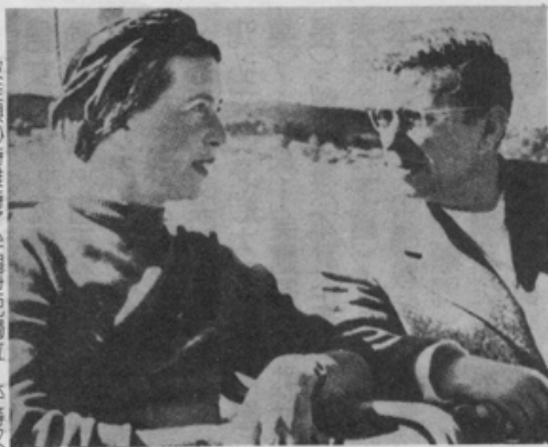
波娃與沙特維持了半個世紀獨立、平等又緊密相依的男女關係。

這些他們都做到了，因而成功地逃避了佔有、嫉妒、忠貞，以及一夫一妻制的窠臼。波娃極清楚自己最想要的是工作，並從來就拒絕婚姻，認為婚姻對女人是沒有好處的，只能使女性陷入對她不利的傳統男女關係裡。基於同樣的理由，波娃不會想過要生小孩，而且終其一生慶幸自己這樣的抉擇。