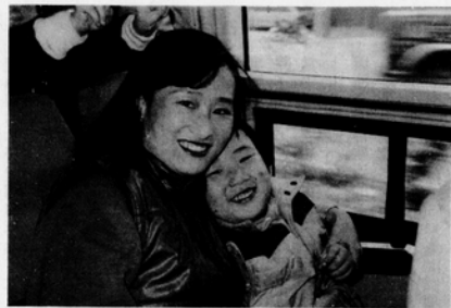
作者與兒女之合照

這星期的聚會，經過討論後，一致決定在明年我們要接受一連串的溝通訓練，由我們自己決定課程內容，自己擬定計劃，並尋覓適當的帶領人選，只要有這種主動求知的精神，誰說十個臭皮匠不會成爲一個諸葛亮呢？