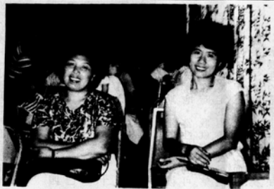
(者作為即二左片照)

發增強，受不了別人的奚落，尤其看到同性的不長進，於是乎主婦的問題如同投石的水波，一圈圈的擴大，尤其今年為甚，三月八日婦女節更趨高潮，報章、雜誌、演講以主婦為題的比比皆是，其中莫過於婦女新知所辦的「婦女成長團體」，九次的活動知性和感性相互交替，到現在已近歲末還解很多朋友津津樂道，使一些自我陶醉的媽媽們由此醒悟，而後舒解出來，想想何謂「生活品質與期待」，何謂「再出發」，再出發的條件又是什麼，必要嗎？如果再出發妳是否更快樂。