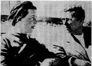
波娃與沙特談時留影

西蒙：毫無疑問！當一種所謂自由關係發展到像是婚姻關係時——如果我們共同生活在同一個屋子裡，經常一起吃飯——不管如何，女方將扮演她傳統的女性角色。這樣的關係與婚