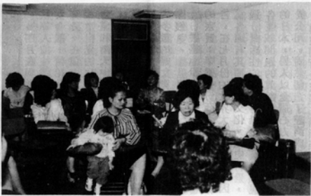
成長團體聚會實況

甲：有用嗎？孩子會聽話？ 乙：你溫和而堅定就會。 甲：好像很難囉，你不知道我那孩子……，唉！ 乙：所以要有成長聚會，學習如何合理有效的應付孩子的壞行為啊，到底你是要會帶孩子，還是要被孩子帶？