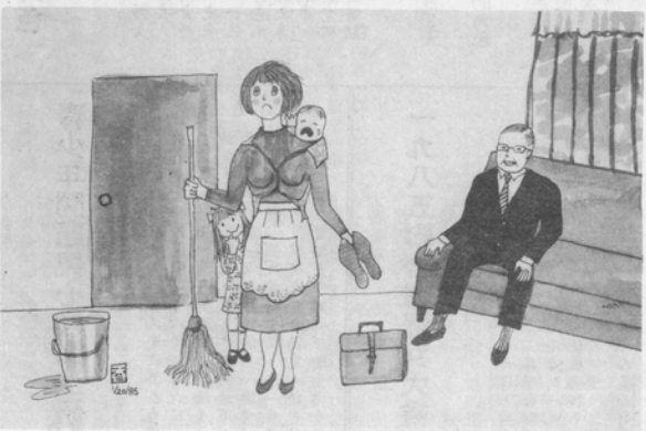
夫：「妳的氣質都到哪裡去了？」

運動者曾討論過這些問題。她們說我們必須拒絕大男人主義的價值和程式，我們應該創造一些完全不同的東西。我不同意這些。事實是文化、文明和普通的價值皆已為男人所創造，男人代表著普遍。在現存普遍價值中，男人經常留下其大男人雄性的標記在其上，因此，將之分離及避免混淆很有問題。這是婦女們必須面對的問題之一。婦女必須利用男人所創造的價值與工具如男人平等，但必須保持警惕。否定（拒絕）男性的程式將表示什麼意思？難道柔道是男人學的，婦女就不能去學習的嗎？我們不必排斥男人的世界，終究，這也是我們的世界。