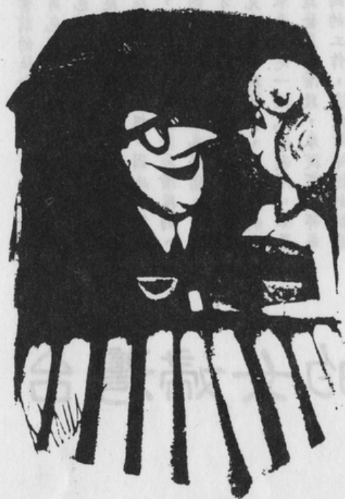
每個偉大的男人背後都需要一位女人

在聯合財產制之下，妻子除了別人贈送以及結婚時已有的財產之外，其餘靠自己勞力賺來的所得，用原有