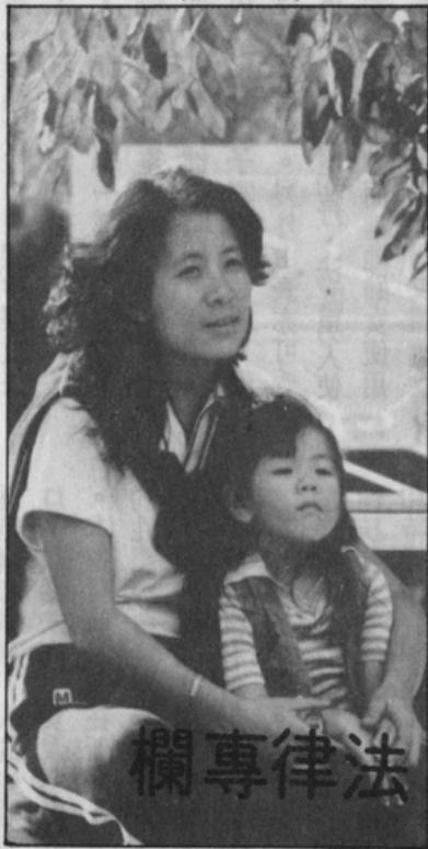
法 律 專 欄

依照我國最高法院之判決，夫妻於離婚時約定只有一方對於未成年子女有監護權，則另一方的監護權只是一時停止而已，並不因此喪失。倘若有監護權的一方因故死亡，則另一方之監護權就當然回復，比其他任何人都優先