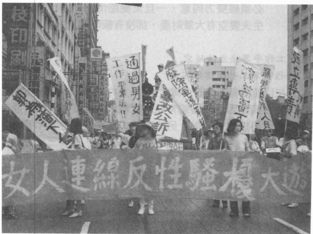
1994 年由婦女新知基金會發起的「522 女人連線反性騷擾」大遊行 (1994/5/22)。

我們呼籲女選民將選票投給支持男女工作平等法的立法委員，包括 葉菊蘭、高惠宇、朱惠良、林濁水、陳癸淼、林政則、劉進興、簡錫土皆、范巽綠 （最後三人為不分區立委）等人，以利該法案的推展。