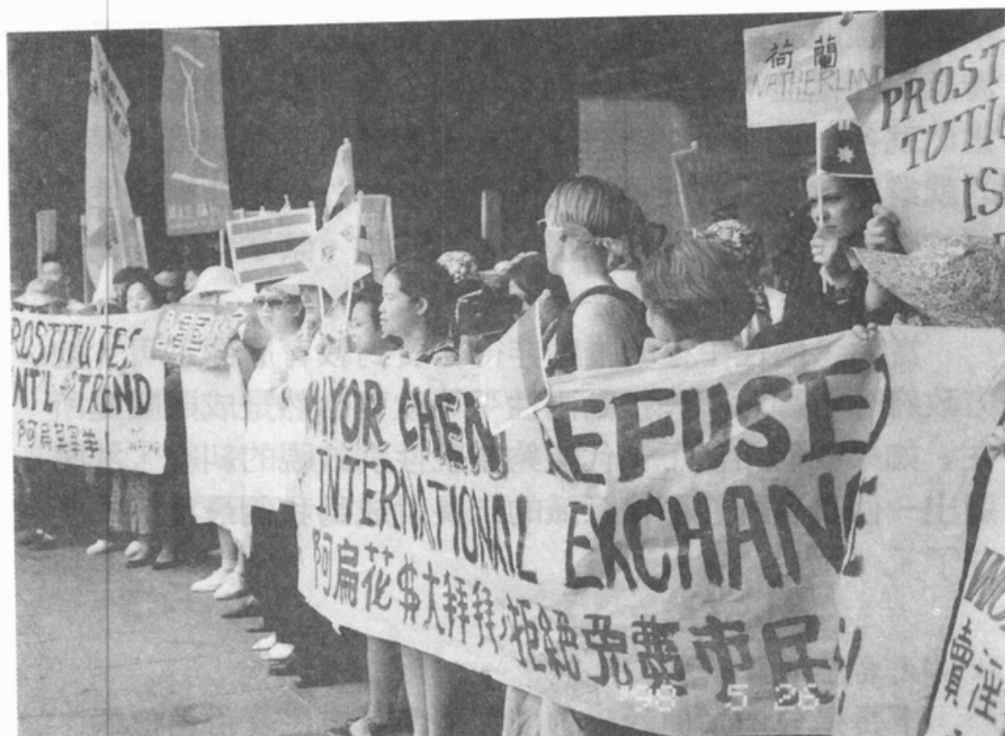
台北市政府的廢娼政策，在公娼自救會、女工團結生產線及粉領聯盟舉辦的「性工作權利與性產業國際論壇」中，遭各國代表嚴正抗議(1998/5/26)。

其次，如果市長的施政違背您或弱勢市民的利益，別忘了，您可以上網路表達妳對市政的看法，或更積極的聯合您社區內的婦女或熱心公共事務的居民，共同去遊說其他市議員，尋求多數市議員的支持，帶給市長壓力。面對輿論壓力，如果他還是裝聾作啞，毫無悔意，下次選舉時，記得用選票叫他走路！